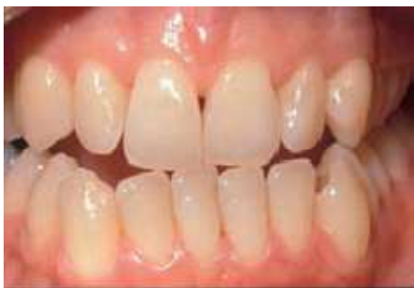
Voor het bleken

De lengte van een bleekbehandeling hangt af van de bleekmethode. Bij de thuisbleekmethode duurt het meestal twee weken voordat u een gewenst resultaat bereikt.