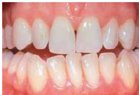
Resultaat na tien dagen bleken met de thuisbleekmethode onder begeleiding van de tandarts

Kunnen alle tanden en kiezen worden gebleekt? Tijdens een bleekbehandeling kleuren vullingen, facings (een schildje van porselein of composiet), kronen en bruggen niet mee. Een bleekbehandeling voor die tanden of kiezen heeft dus geen zin. Bezoek daarom uw tandarts of mondhygiënist vóórdat u uw tanden laat bleken. Bespreek uw wensen en vraag of het door u gewenste resultaat haalbaar is.